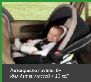
Автокресло группы 0+ (для детей массой < 13 кг)*