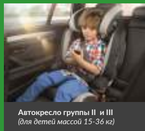
Автокресло группы II и III (для детей массой 15–36 кг)