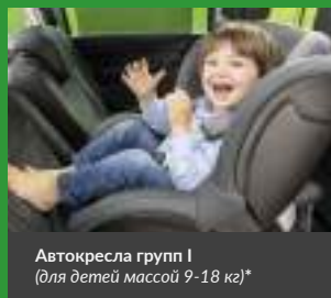
Автокресла групп I (для детей массой 9–18 кг)*