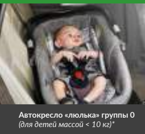
Автокресло «люлька» группы 0 (для детей массой < 10 кг)*

При покупке детского удерживающего устройства обязательно следует уточнить у продавца наличие сертификата на товар!